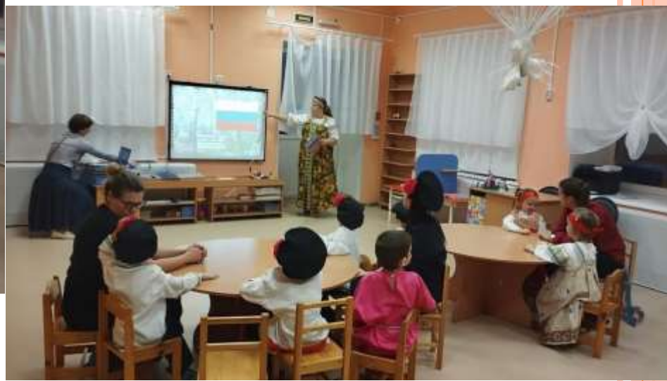
Приобщение к фольклору семей воспитанников.